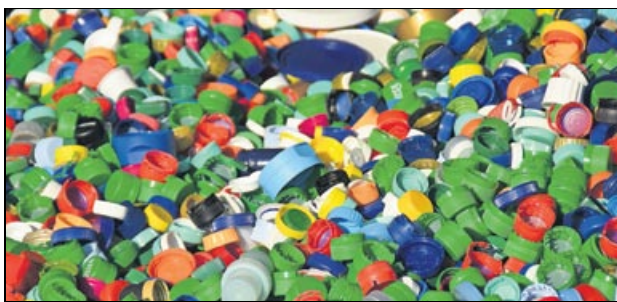
Weiter gefragt: bunte Kunststoffdeckel.

Als neue zentrale Lagerstätte dient ein begehbare Container auf dem Hof der Spedition Nanno Janssen an der Ubierstraße. Dort werden bis einschließlich 30. Juni 2018 die Deckel in „bigbags“ gesammelt. Den Transport zur Recyclingstation in Lüneburg organisiert der Verein „Deckel drauf e.V.“.